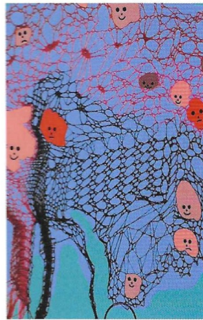
Ontwerp flyer Bea Meys